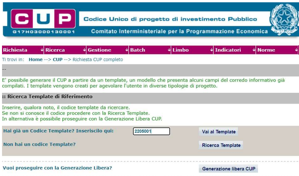
Fig. 1 – Inserimento del Codice Template

STEP 3. Seguire la procedura di generazione guidata compilando le schermate nell'ordine previsto.